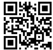
民間相談機関 連絡協議会HP

お振込みを確認後、ZOOM ミーティングID とパスワード、講演会資料をメールにてお送りします。