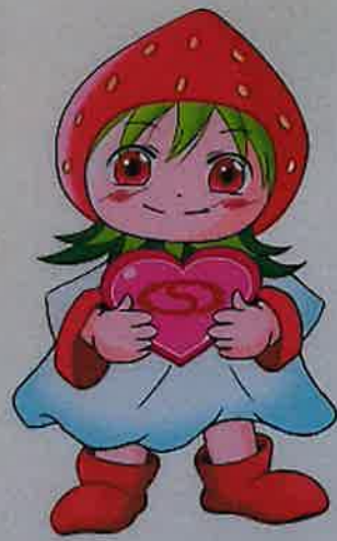
福岡県社会福祉士会 イメージキャラクター うまもちゃん