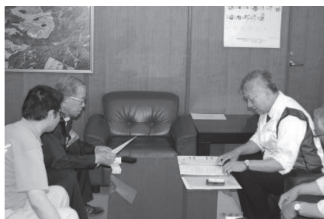
西原村村長（左）と鎌倉会長（右）（6月13日）