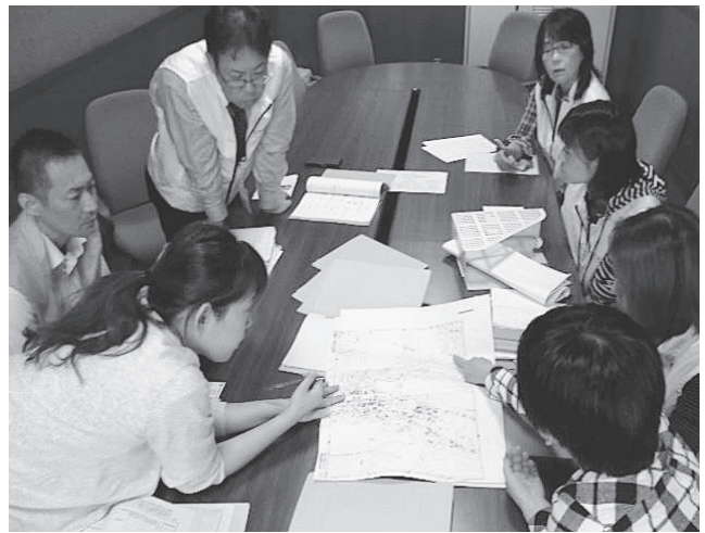
大洲市包括支援者との打合せ