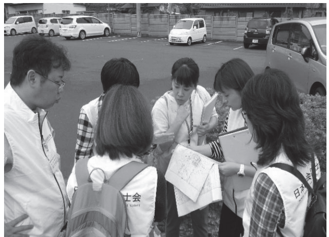
現地での引継ぎ（大洲市）